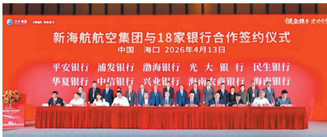
第六届消博会期间,海南农商银行与新海航航空集团签署合作协议,通过银团贷款等方式为企业发展提供金融支持。

作为本土法人金融机构,海南农商银行坚守“支农支小”主责主业,聚焦特色农业、海洋水产、精品制造、商贸消费等重点领域,创新金融产品、优化服务模式、畅通融资渠道、降低融资成本,切实履行地方金融责任担当。同时,立足海南、服务大局,主动融入自贸港“45432”发展架构,全力支持省市重点项目、基础设施、产业园区及民生工程,为自贸港封关运作提供坚实金融支撑。海南自贸港启动封关运作以来,该行为自贸港建设企业累计投放贷款超187.2亿元,支持省内重点项目25个、重点产业客户62户;全行国际结算量同比增长181.25%,跨境人民币结算量同比