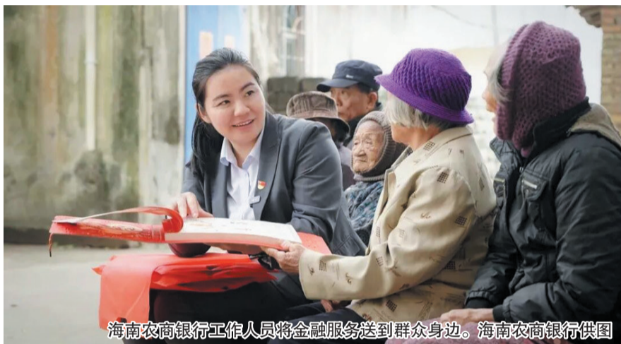
海南农商银行工作人员将金融服务送到群众身边。

2025年，聚焦群众急难愁盼，海南农商银行将贴心服务送到群众身边。全年开展上门服务1200余次，举办金融宣教活动千余场，收获了许多锦旗与感谢