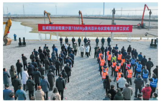
盐城射阳黄沙港78MWp渔光互补光伏发电项目开工仪式现场。

中国电建海南院表示,项目开工建设后,中国电建海南院将坚守高标准、严要求的工作导向,深入项目现场严抓细管,强化安全生产标准化工作。同时,公司将积极引入行业内先进前沿的技术手段,不断优化项目设计和施工方案。在严格把控质量的前提下,确保项目如期交付,将黄沙港光伏发电项目打造成国内一流的渔光互补示范工程。